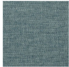
water green 03