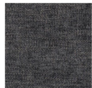
dark grey 20