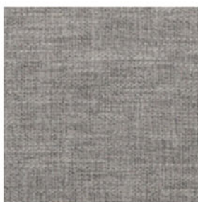
light grey 06